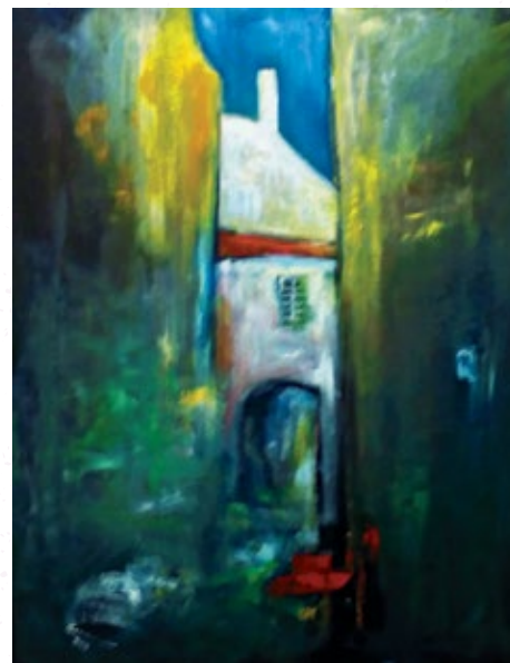
Staré mesto IV, 70 x 90 cm, olej

2017 - Galeria Sztuki „BROWAR B“ WLOCLAWEK - PL