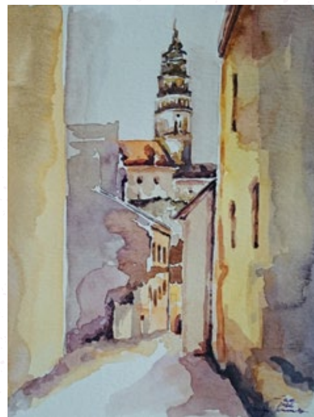
Český Krumlov, akvarel

2017 Galerie Těšínského Divadla - „SALON SAP 2017“