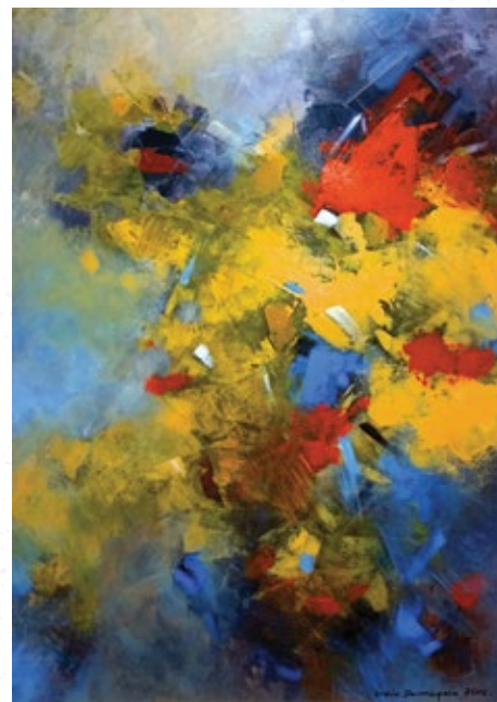
IGRASZKI BARW“ akryl na płótnie, 90 x 60, 2016

2017 r. Wystawa malarstwa z córką Jolantą /szkło art. / - W DUECIE - Browar B /Wrocławek.