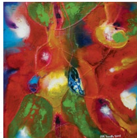
Léto, 70 x 70 cm, akryl, 2017

prodejna Opus, Praha 1, Dlážděná ul. atd., vše dřevo, přírodní, polychromované, případně malované