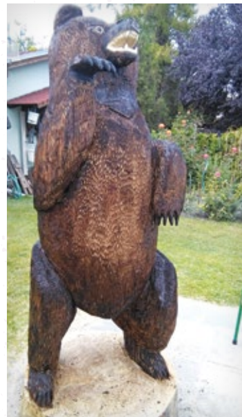
Grizzly, 80 x 280 cm, topol, 2016