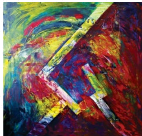
Zo série Zodiac '18 č.10, 80 x 80, akryl na plátne

Spolu s dvěma spoluzakladateli jsme v roce 2017 založili volnou skupinu umělců Hala-Bala, které jsem se stala ředitelkou.