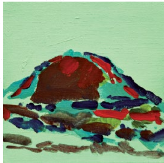
Z cyklu ŘÍP, 30x30 cm

V roce 1999 obdržela stipendium ND, Zurich, Švýcarsko.