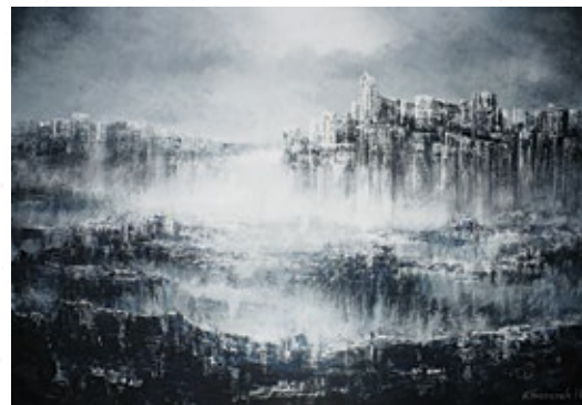
...W stronę światła IV... 70x100, akryl na płótnie, 2018

Uprawia malarstwo sztalugowe i rysunek. Udział w 41 wystawach indywidualnych między innymi w Lubaniu Śląskim, Koszalinie, Słupsku, Włocławku, Ciechocinku, Warszawie, Toruniu oraz w Chicago i Detroit - USA i Paryżu - Francja. Członek Związku Polskich Artystów Plastyków. Udział w 34 plenerach malarskich regionalnych, ogólnopolskich i międzynarodowych. W 2009 i 2016 roku Nagroda Prezydenta Miasta Włocławek w dziedzinie kultury a w 2012 r wyróżnienie. W 2010r odznaczony Srebrnym Krzyżem Zasługi za działalność społeczno-kulturalną. Udział w ponad 90 wystawach zbiorowych i konkursach w tym w 9 o randze międzynarodowej. Nagrody i wyróżnienia w konkursach. Prace wystawiane były w Polsce oraz w Niemczech, Danii, Holandii, Serbii, Włoszech, Ukrainie, Francji, Słowacji i Czechach. Obrazy znajdują się w zbiorach muzealnych, instytucjach państwowych, galeriach i kolekcjach prywatnych w kraju i za granicą.